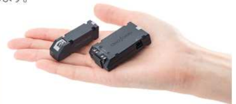
温度モジュール: 54×13.2×17.5mm / 11g 電圧モジュール: 54×30×13.4mm / 25g