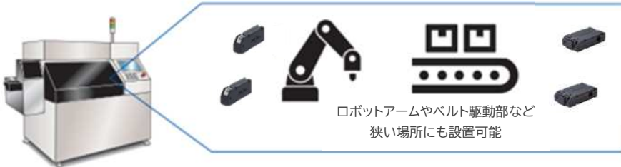
ロボットアームやベルト駆動部など 狭い場所にも設置可能

コンパクトな計測モジュールを使用しており、設置や配線が困難な場所でも煩雑な作業を行うことなく、短時間でのセッティング、計測環境を阻害しない温度/電圧計測が可能です。温度と電圧が混在する多チャンネル(最大200ch)でも、リアルタイム計測、同期モニタリングを実現します。計測モジュールの使用温度は-20℃~60℃、ログ機能搭載でデータ欠損防止。