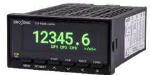
高精度、高応答、広範囲の回転計測が可能です