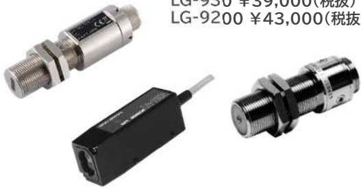
防油、耐熱、超小型などラインアップ豊富

MP-900 / 9000シリーズ ¥9,000(税抜)~ LG-930 ¥39,000(税抜) LG-9200 ¥43,000(税抜)