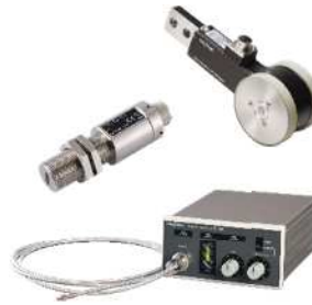
各検出器から正弦波、矩形波を入力