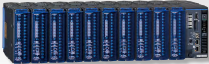
LR8102 本体に M7100 を 10 台接続した状態