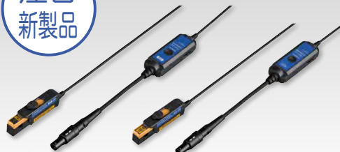
CT7812 CT7822 出力コネクタ：HIOKI PL14 端子