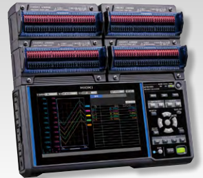
※本体に測定ユニットを4ユニット装着時